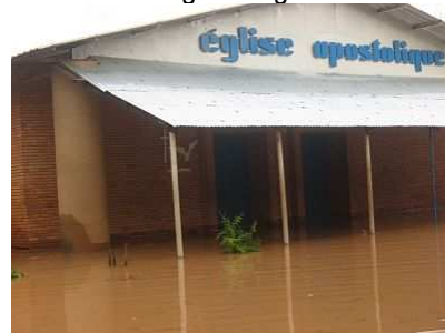
Überschwemmte Kirche in Tanghin

über dem Gelände erhöht. Das galt knapp 20 Jahre, doch jetzt war auch die Kirche überschwemmt. Im Gemeindebüro schwammen die Akten im Wasser, die Primarschule und das Gymnasium standen wie Inseln in der Wassermasse. Beim Pastor war der Pegel an den Hüften und er verkehrte zur Kirche mit einem Boot. Für seine Familie musste ein anderes Haus gefunden werden. Die Frauen hatten indes Glück, ihr Zentrum wurde nicht betroffen. Schlimm stand es auch mit dem Brunnenprojekt. Wegen der Wassermassen konnte das Gelände erst am Abend erreicht werden und auch so hatte es noch 1 m Wasser auf dem Gelände. Lastwagen und Geräte sind unbrauchbar geworden. Auch hier waren alle niedergeschlagen.