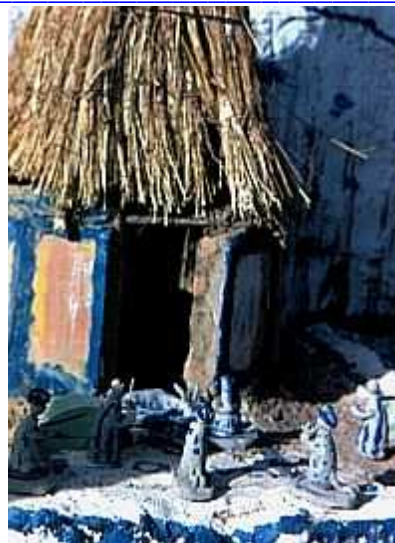
Kinder basteln in Ouagadougou Krippenfiguren aus Ton und Stroh

Die Anzahl der Leute, die nicht lesen können, ist in Afrika im Steigen begriffen. Umso mehr danken wir den Frauen unserer Partnerkirche für ihr Alphabetisierungsprogramm das gute Früchte trägt. Im neuen Jahr dürfen wir für die Gemeinde in Burkina mit Gottes Beistand rechnen. Es geht darum, dass sich die Arbeit konsolidiert und weiter Menschen errettet werden.