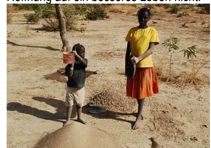
Kinder bei der Sandgewinnung