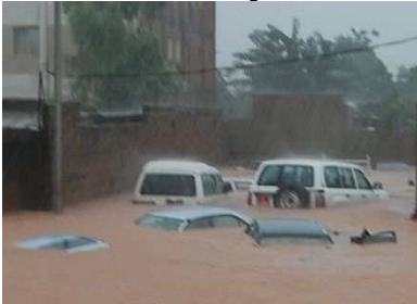
Autos im Wasserbad

Dieses Datum bleibt allen unvergesslich: 1.9.09. Die flutähnlichen Regenfälle begannen um 4 Uhr morgens, als ob der Sahel die Wasserdefizite nachholen wollte und das dauerte bis zum Abend. Ganze Quartiere von Lehmhäusern wurden weggetragen. Doch auch solide Häuser litten – das Unispital musste evakuiert werden und ein Neuaufbau steht an. Über 300 mm Wasser pro m 2 hatten sich innert weniger Stunden über die Stadt ergossen.