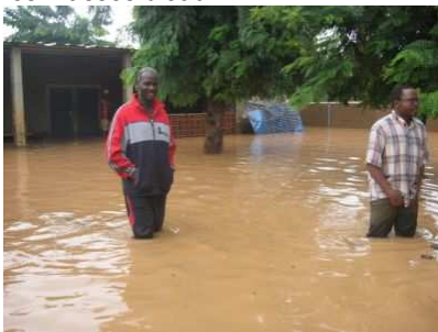
Le pasteur dans la cour de l'église

Le bilan des dégâts est très lourd, presque 25'000 logements ont été détruits par les masses d'eau. 150'000 personnes ont dû être évacuées dans des sites d'hébergement, par exemple dans des écoles, alors que commençait au même moment la nouvelle année scolaire. Les dégâts matériels sont immenses. Neuf personnes sont mortes noyées dans les masses d'eau.