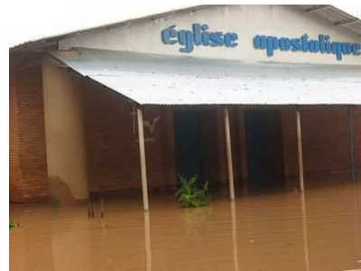
L'église de Tanghin inondée

nous avons construit cette église nous pensions parer à toute éventualité en bâtissant l'église 1 mètre au-dessus du sol. Mais pendant ces crues elle a également été inondée. Dans le bureau de l'église, les dossiers flottaient dans l'eau, l'école primaire et le lycée étaient comme des îlots émergeant des masses d'eau. Le pasteur avait l'eau jusqu'à la hanche et il circulait en barque. Nous avons dû lui trouver une autre maison. Les femmes ont eu plus de chance, car leur centre n'était pas touché. Par contre le programme de construction de puits a été durement touché. A cause des masses d'eau, les responsables n'ont pu atteindre leurs bureaux que le soir. Déprimés, ils n'ont pu que constater les dégâts: les camions et les machines sont devenus inutilisables.