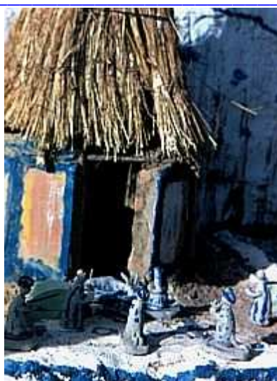
Les enfants fabriquent des crèches d'argile et de paille dans les rues de Ouagadougou

Nous savons que nous pouvons compter sur l'aide de Dieu, également l'année prochaine. Nous souhaitons que l'œuvre s'affermisse et que des personnes soient sauvées.