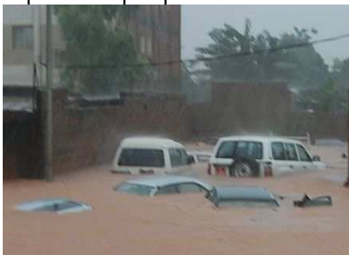
Des voitures prenant un bain d'eau

A Ouagadougou personne ne pourra oublier cette date: 1.9.09. Dès 4 heures du matin des pluies torrentielles se sont déversées sur le sahel - comme si cette région devait combler son déficit en eau - et ont duré jusqu'au soir. Des quartiers entiers, ceux dont les habitations sont construites en banco, ont été emportés par les flots. Les constructions solides ont également souffert: l'hôpital universitaire a dû être évacué et doit être reconstruit. Plus de 300 mm d'eau par m 2 se sont déversés sur la capitale en quelques heures.