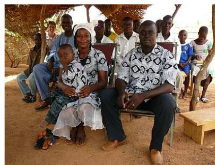
Gottesdienst in Djibo im Freien