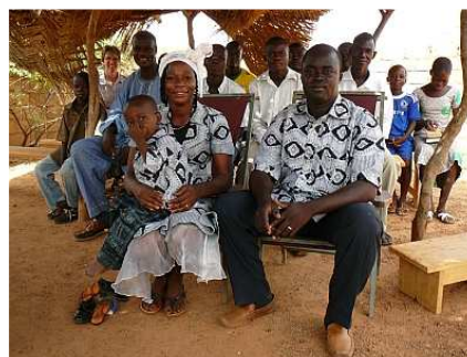
Culte en plein air à Djibo